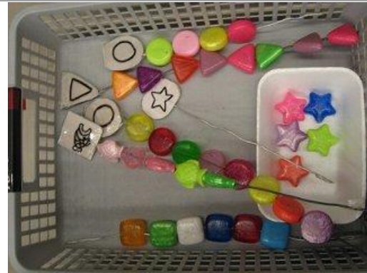
形ごとにビーズを通します