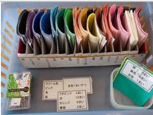
指示所のおりに色紙をとって一つにまとめます。