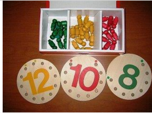
数字と同じ色のペグをさしていきます