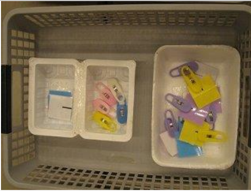
同じ色の色板と洗濯バサミを合わせます