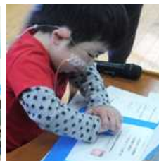
参加カードへの押印