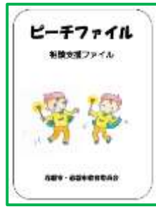
赤磐市『ピーチファイル』