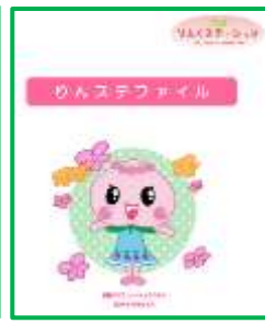
『りんステファイル』

『りんくる』のファイルにつきましては、新転入生の中で、まだお持ちでない方に、本日配付させていただきます。在校生の方で、令和2年7月の改訂版をお求めの方は、「岡山市発達障害者支援センターひか☆りんく」「各福祉事務所」「各保健センター」「こども総合相談所」等で配付されておりますので、お取り寄せくださればと思います。