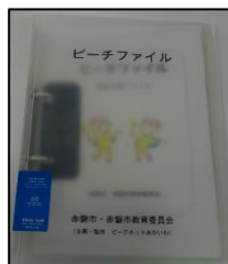
赤磐市 『ピーチファイル』