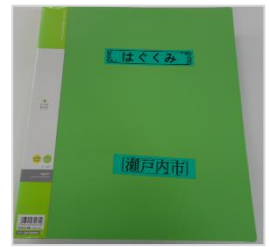
【瀬戸内市:はぐくみ】