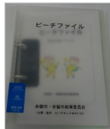
【赤磐市:ピーチファイル】